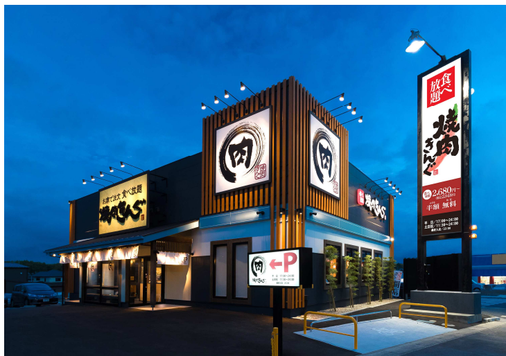
◀ 従来型(郊外ロードサイド)のモデル店舗外観