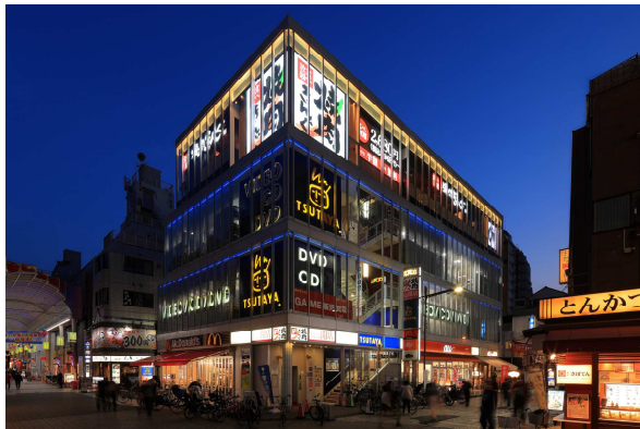
▲ 浅草エリアの複合商業施設 「浅草ROX2G」4階に出店

「都市型ビルイン店舗」出店の主目的は、「今後の出店立地拡大を見据えた、次なる成長の源泉の発掘」と「認知拡大」の2つです。『焼肉きんぐ浅草ROX店』においては、繁華街立地における業態運営が成立するかの検証も合わせて実施いたします。今後も、多くのお客さまに愛される『焼肉きんぐ』を目指すとともに、さらなる事業成長に向けた取組を推進してまいります。