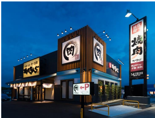
▲画像はイメージです。

株式会社物語コーポレーション（本社：愛知県豊橋市、代表取締役社長CEO：加治幸夫）は、2019年8月19日『焼肉きんぐ杉戸店』のオープンで、国内500店舗を達成します。