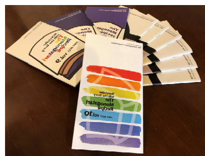
▲「物語レシピ」Vol.1～10 手前がvol.10

当社の経営理念「Smile & Sexy」は“自己実現を目指す”理念です。すなわち、理念体現がそのまま自己実現に繋がると考えています。経営理念を一人ひとりが理解し、体現するためのツールとして「物語レシピ」という小冊子を期初に全社員に向けて配布しています。毎年内容やデザインのブラッシュアップを行い、今期で“vol.10”を迎えました。掲載内容は「ビジョン」「経営理念」「行動指針」の3つにカテゴリズされています。また、巻頭ページに自分の美学や今期の個人目標、仕事目標などの「自分物語」を書き込む仕様となっており、「物語レシピ」を受け取った全員が、会社の方針を理解した上で「自分物語」を記入します。この一人ひとりの「自分物語」は、当社豊橋フォーラムオフィス・東京フォーラムオフィス玄関に全員分が掲示されます。