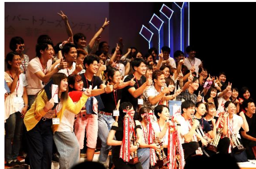
▲昨年の表彰式の模様（店舗での全国大会後 穂の国とよはし芸術劇場PLATにて開催）

本コンテンツは愛知県豊橋市、豊川市の当社店舗にて行います。取材のご希望がございましたらご連絡いただけますと幸いです。なお、全国大会の結果につきましては、大会後のリリースにて改めてご報告させていただきます。